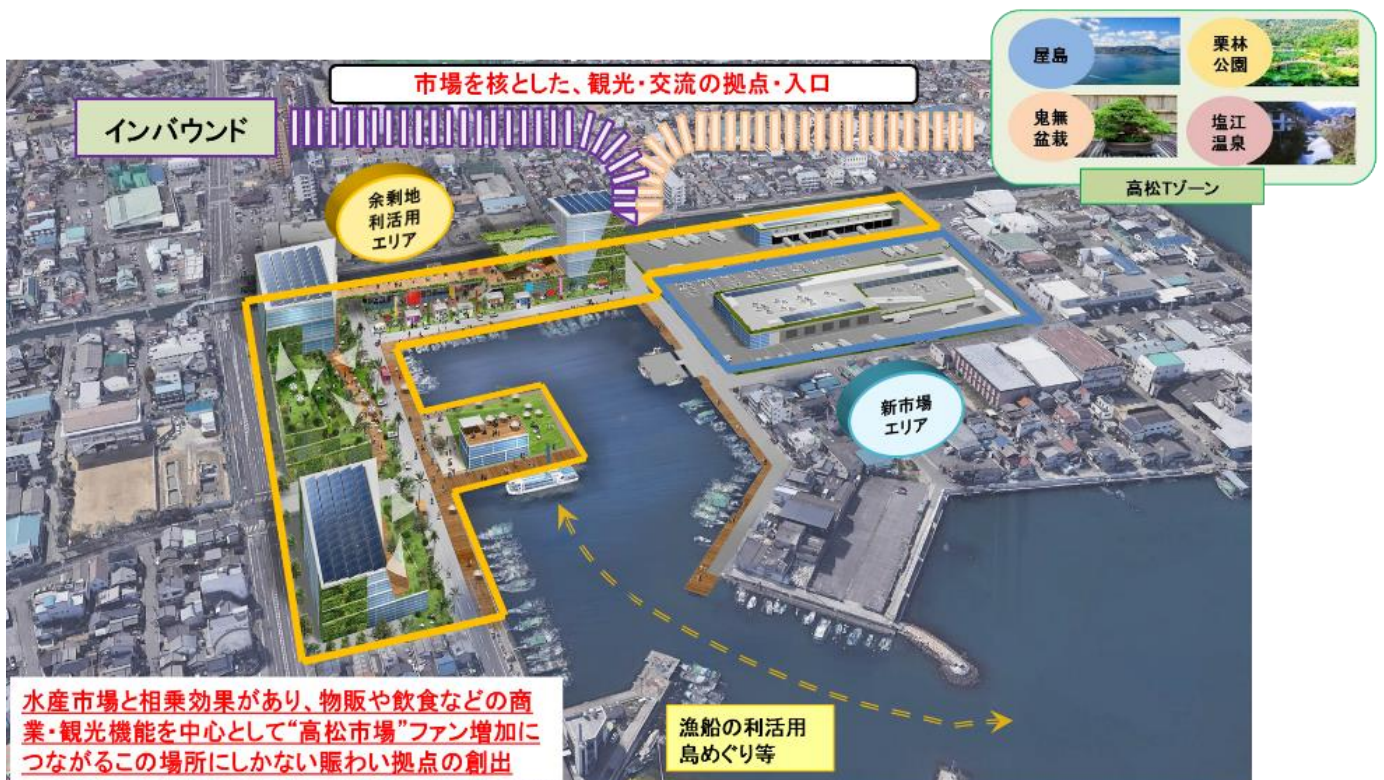
図 再整備イメージパース

(本イメージは想定であり、このような開発となることを約束するものではありません)