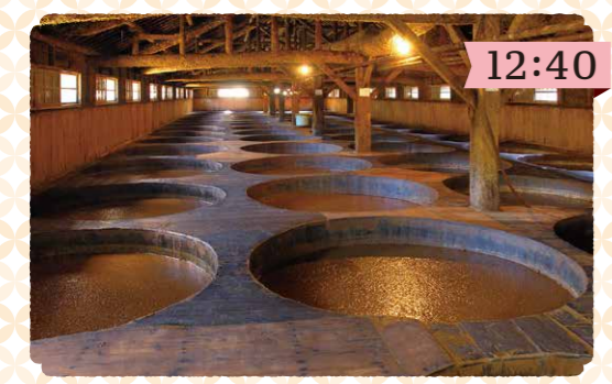
醬の郷を散策 20以上の醬油蔵や佃煮工場が軒を連ねるエリア。昔ながらの街並みも魅力。 滞在時間 約40分