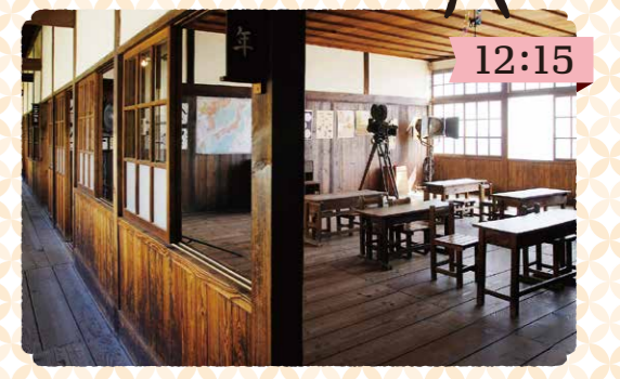
二十四の瞳映画村で昼食 撮影セットや映画館、ギャラリーのほか、小豆島グルメも楽しめます。(☎0879-82-2455) 滞在時間 約2時間