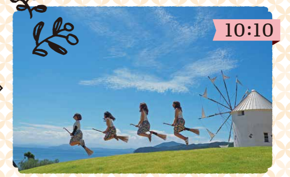
道の駅 小豆島オリーブ公園 幸せになれると噂のハート型のオリーブの葉っぱを探してみよう。(☎0879-82-2200) 滞在時間 約1.5時間