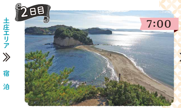
エンジェルロードを散歩 朝の澄んだ空気の中、エンジェルロードをぶらりと散歩。干潮の時間は季節により異なります。 滞在時間 約1時間