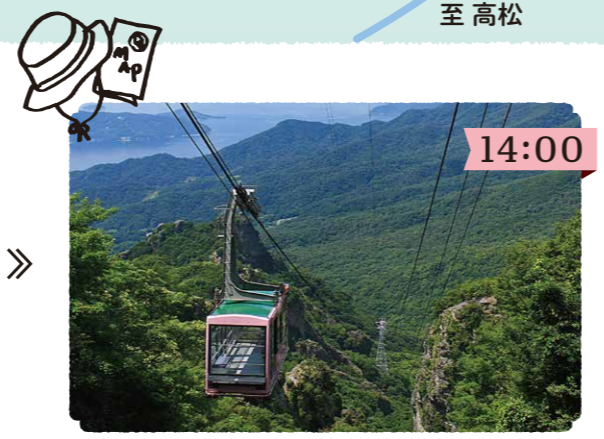
寒霞溪でハイキング 火山活動によってできた奇岩怪石の絶景を眺めながらの登山を楽しもう。(☎0879-82-2171) 滞在時間 約2時間