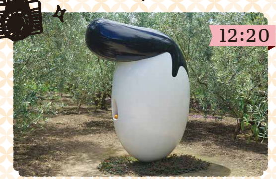
「オリーブのリーゼント」を鑑賞 彫刻であり、野菜や果物の無人販売所。一風変わったアート作品。 滞在時間 約5分