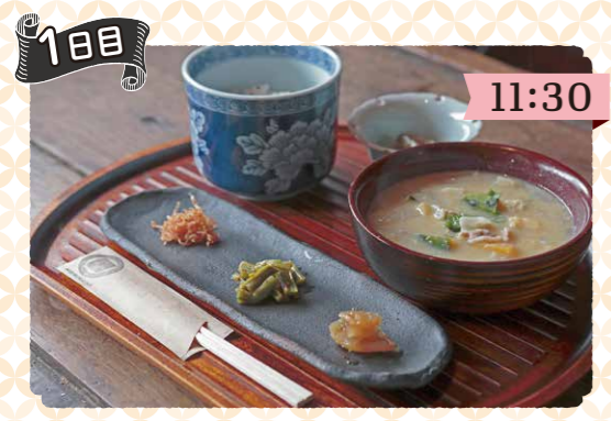
森國酒造で昼食 具だくさんの粕汁でヘルシーランチ。近くにはベーカリーカフェも。 滞在時間 約40分