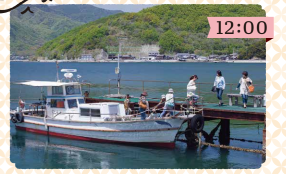
渡し舟で近道! 映画「二十四の瞳」でも描かれた渡し舟で映画村へ!(☎090-7781-5112) 渡し舟所要時間 約10分