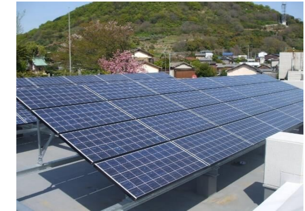
市有施設太陽光発電