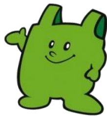
レジ袋等の削減推進シンボルキャラクター （愛称 エコバックくん）

平成20年に市民等から公募し、応募総点数160点から、優秀賞の作品を「レジ袋等の削減推進シンボルキャラクター（愛称 エコバックくん）」として選定した。