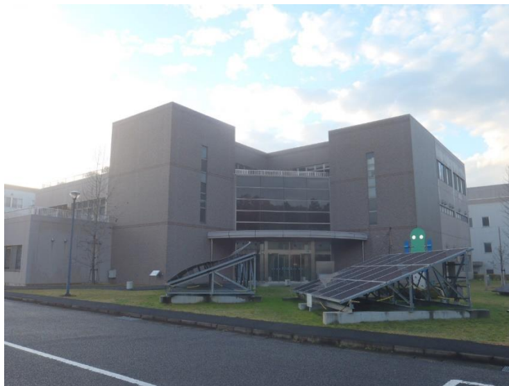
《写真 南部クリーンセンター》

高松市塩江町安原下第3号 2084 番地 1 TEL 087(890)2190 FAX 087(890)2191