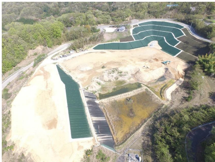
《写真 南部クリーンセンター埋立処分地》