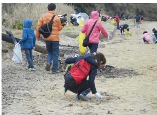
平成25年3月3日屋島クリーン大作戦