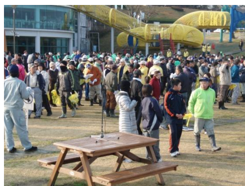
平成25年1月27日高松エアポートクリーン作戦