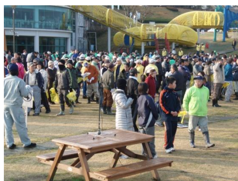
平成24年1月22日高松エアポートクリーン作戦