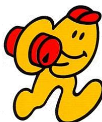
シンボルキャラクター (愛称 カンクルちゃん)