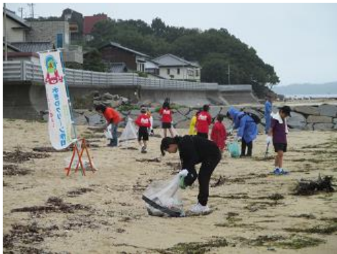
令和元年7月14日あじ水ぎわクリーン作戦