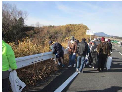
令和2年1月19日高松エアポートクリーン作戦