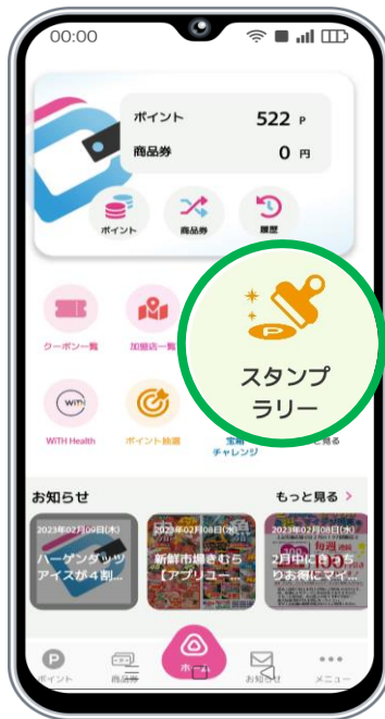
«My Digital Wallet»