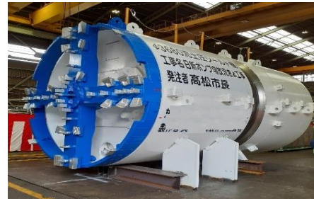
シールドマシン(工場検査時)