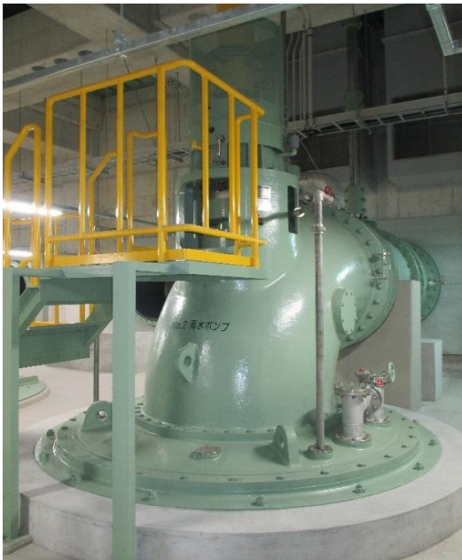
福岡ポンプ場 立軸ポンプ

下水道事業計画区域内における浸水被害を軽減・解消するため、中心市街地浸水対策計画等に基づき、引き続き、雨水幹線及び雨水ポンプ場の整備を進めています。