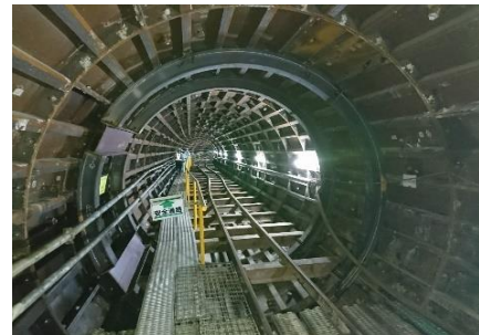
西部バイパス幹線 管きょ内(一次覆工状況)