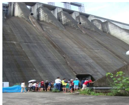
早明浦湖水祭「四国の子ども交歓会」の様子