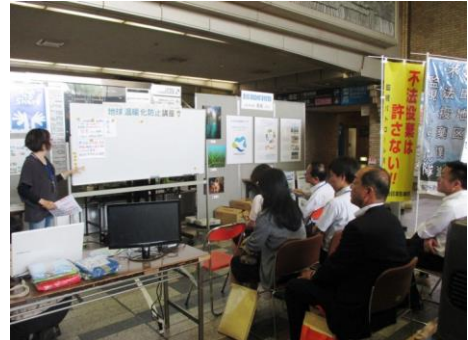
環境展期間中の行事の様子