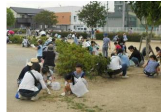
地域との合同クリーン作戦