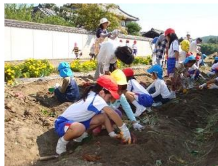
こども農園事業の様子