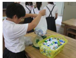
ペットボトルキャップ回収