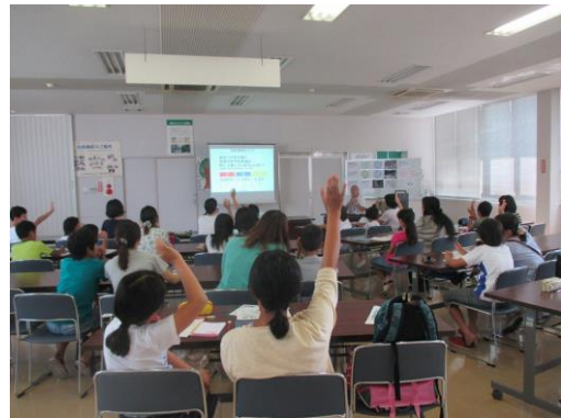
環境ワークショップの様子