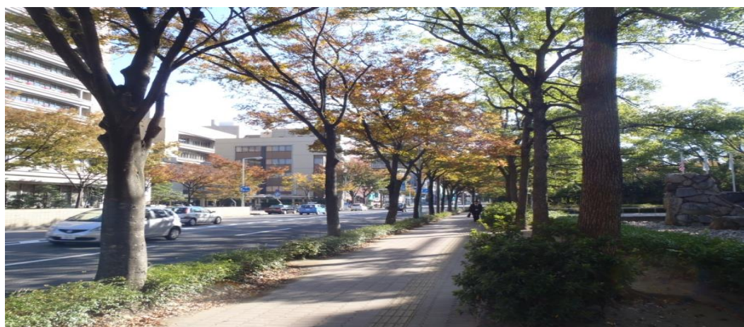
市道五番町西宝線の街路樹（ケヤキ・アベリア）