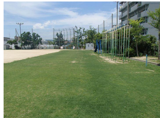
H27年度 木太北部小学校