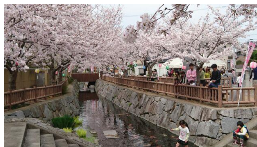
鹿ノ井出水景観整備