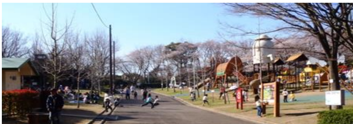
峰山公園はにわっ子広場