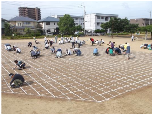
芝生植栽 市民との協働作業