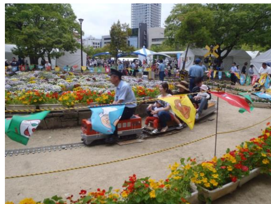
春のフラワーフェスティバル