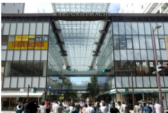
丸亀町グリーン (建築物等に関するもの受賞作品)

平成23年度から美しいまちづくりに対する意識の高揚を図るため、美しいまちづくりに著しく寄与していると認められる建築物等や活動を対象に、4年に1度、美しいまちづくり賞の表彰を行っています。平成27年度には、建築物等6件、広告2件、活動等2件の表彰を行いました。