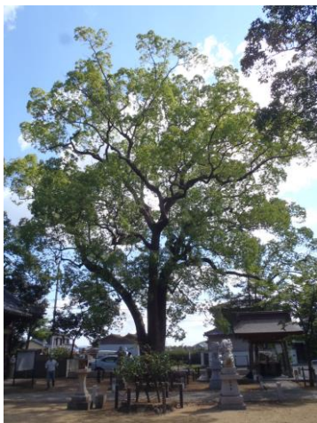
クスノキ (仏生山町)