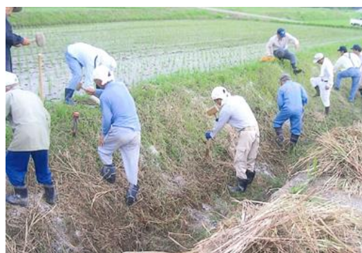
きんしょう 公城の里活動組織 (活動等に関するもの受賞作品)