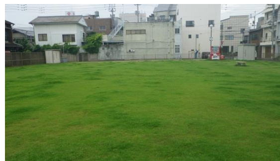
塩上町三丁目公園

本市では、第2次高松市緑の基本計画において、公園の芝生化を重点施策として盛り込み、地域住民との協働の下、平成22年度より本格的に公園の芝生化事業に取り組んでいます。平成27年度末までに13公園で供用しています。