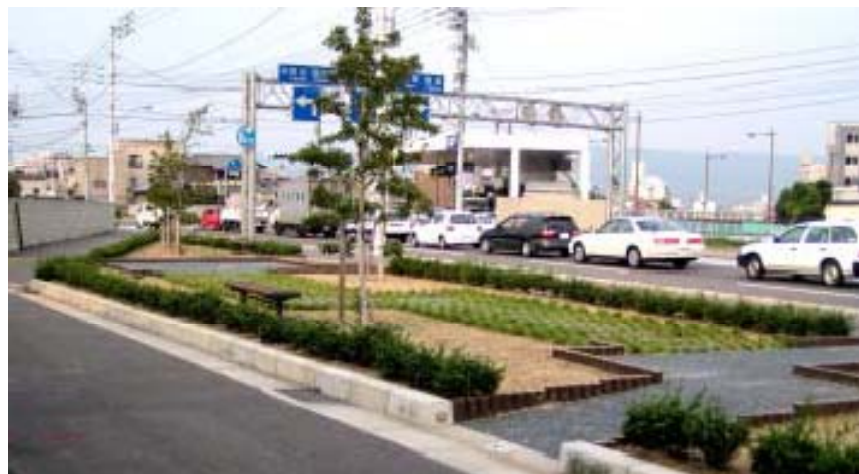
花園町ポケットパーク