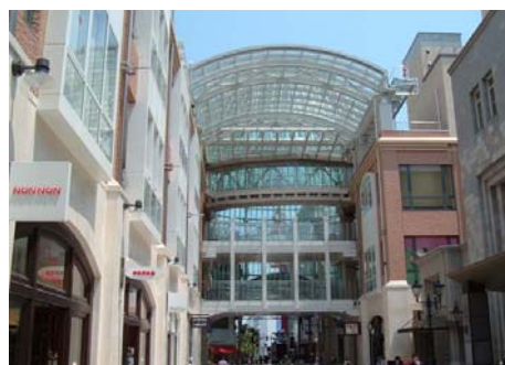
高松丸亀町老番街ビル