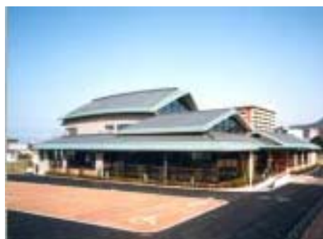
ふれあい福祉センター勝賀