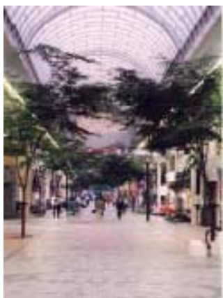
第1回優秀賞 街路樹のあるアーケード街

第2回（平成11年度） 31点の応募作品の中から優秀賞1点・入選5点を表彰しました。