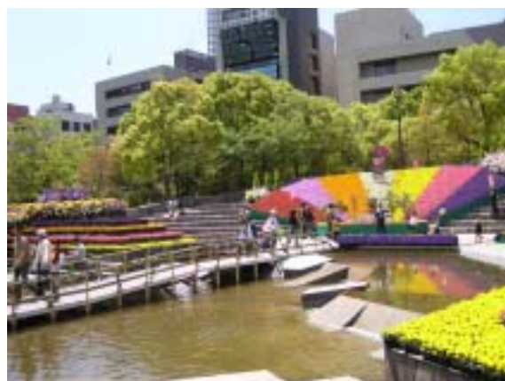
春のフラワーフェスティバル