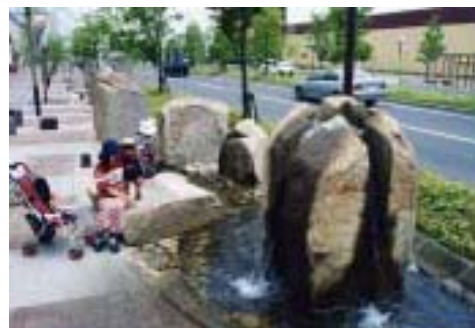
第2回優秀賞 小川のある町