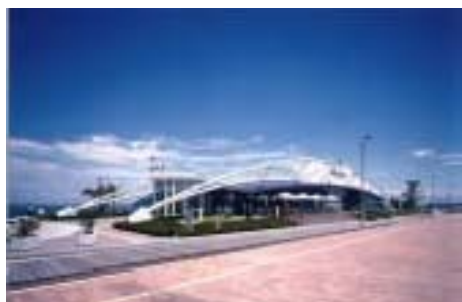
高松港レストハウス

第4回（平成15年度） 50件の応募の中から6件を決定し、所有者・設計者・施工者に対して表彰しました。