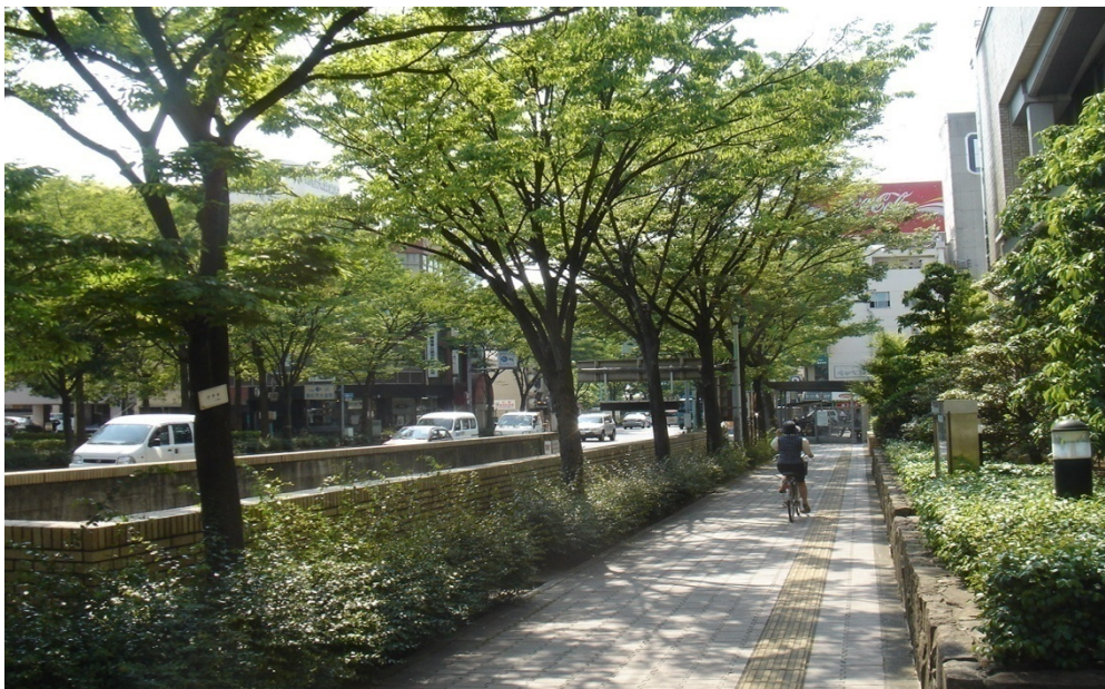
市道五番町西宝線の街路樹(ケヤキ・アベリア)