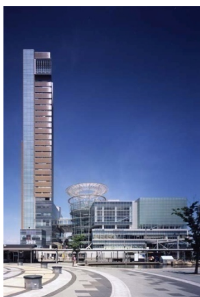
高松シンボルタワー

第5回（平成19年度） 27件の応募の中から5件を決定し、所有者・設計者・施工者に対して表彰しました。