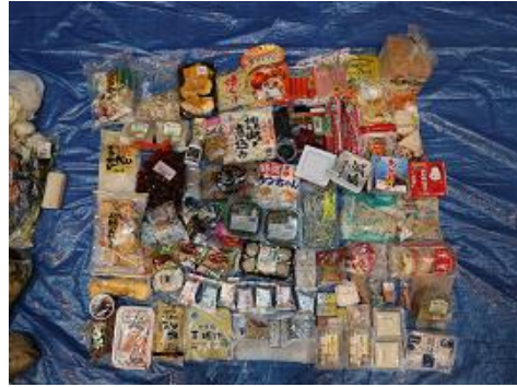
調査したごみの中から 出てきた未開封食品