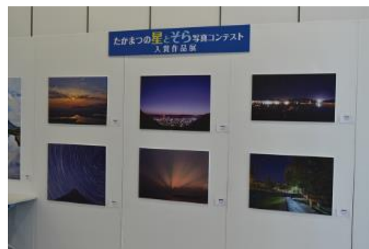
会場の展示ブース