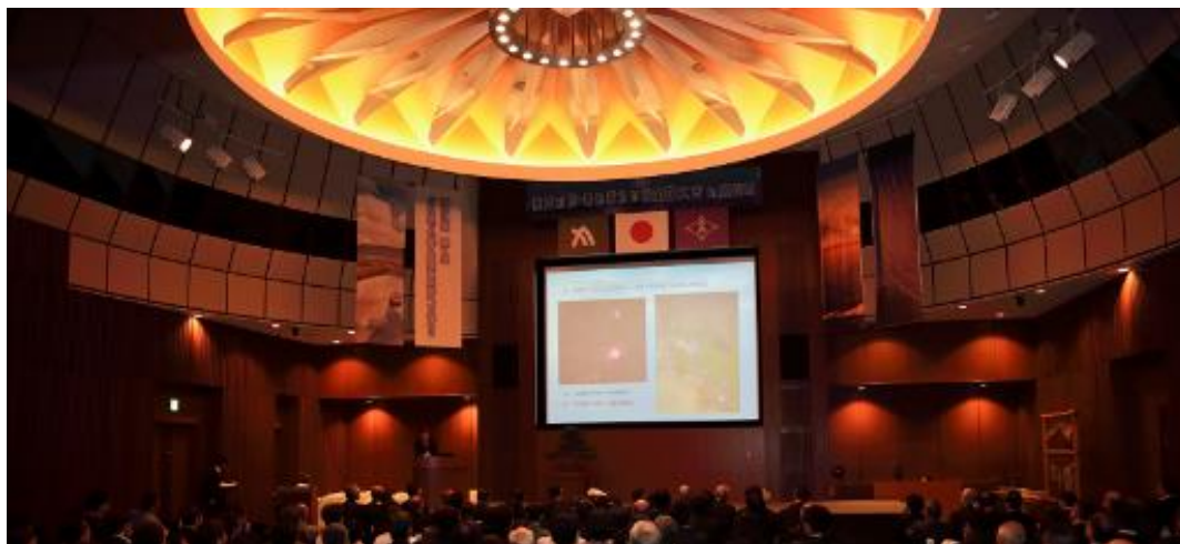
大会会場 かがわ国際会議場内

「星空の街・あおぞらの街」全国大会は、大気環境の保全に対する意識を高めること、郷土の環境を活かした地域おこしの推進に役立てることを目的として、昭和63年以降、毎年全国各地で開催されてきました。平成30年10月に環境省、香川県及び「星空の街・あおぞらの街」全国協議会の主催で、第30回大会を高松市で開催しました。