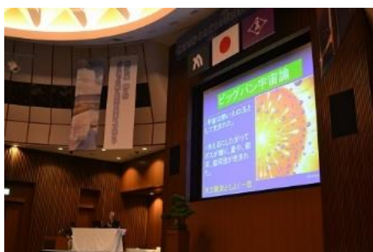
記念講演 佐藤 勝彦 氏