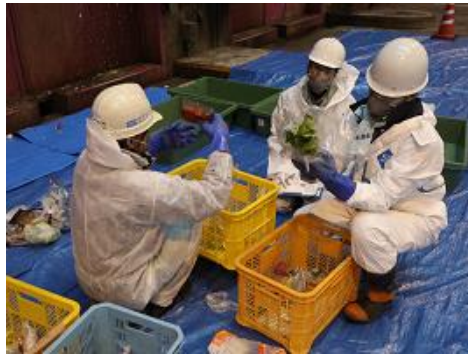
南部クリーンセンターでの 実態調査の様子

食品ロス（本来食べられるのに捨てられる食品）の削減を始めとする食品廃棄物の減量・再資源化を推進するため、食品ロス実態調査や食品ロスに関するアンケート調査を実施するとともに、食品ロス削減のためのリーフレットを作成しました。