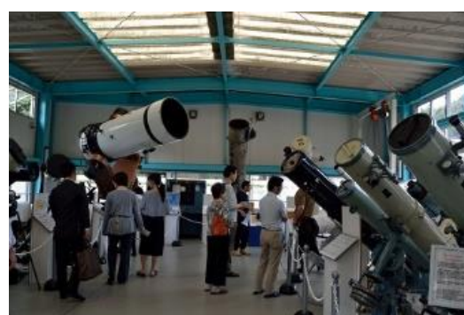
エクスカーショ ン 天体望遠鏡博物館（さぬき市）