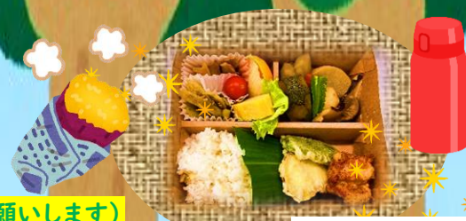
塩江の恵みいっぱい ランチ&おやつ♡