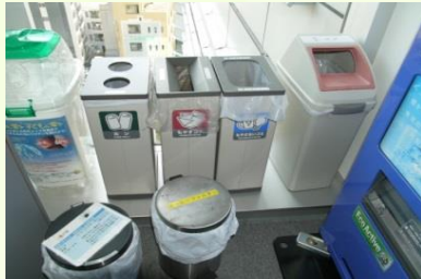
【もえるゴミ・生ゴミ・破砕ゴミ等】