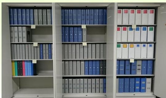
【ファイル保管状況】

不要ファイルなどは、全組織での再利用化できるよう共有スペースに配備。 全組織で3R（リデュース・リユース・リサイクル）による省資源を推進。