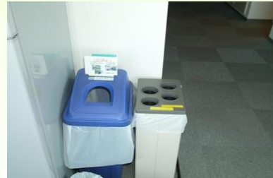
【ペットボトル・キャップ】