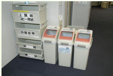
【紙種別ごと・プラスチック類】