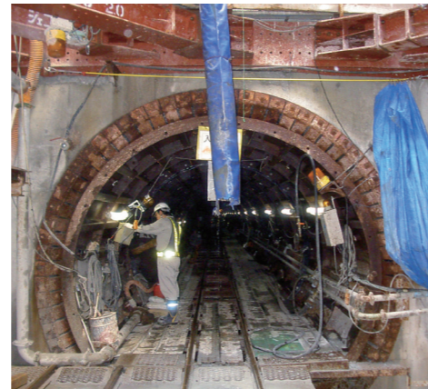
▲ 中部バイパス第2幹線

家庭や工場などから、日々、排出される汚水や排水は、必ず、きれいに処理して川や海に戻さなければなりません。雨水を街に溢れさせることなく、汚水を下水道管で下水処理場まで運び、きちんと処理する。これらは、私たちの快適な暮らしや美しい町づくりを支える大きな役割を果たしています。道路の下に隠れて見えませんが、下水道は欠かせない存在なのです。