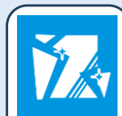
破碎ごみ (有害ごみ含む)