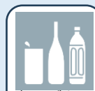
缶・びん・ ペットボトル