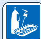
プラスチック 容器包装