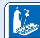
プラスチック 容器包装