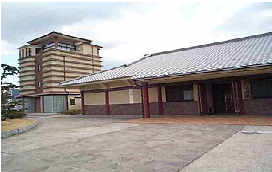
■ 讃岐国分寺跡資料館