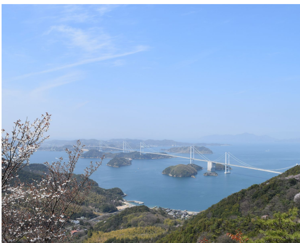
瀬戸内海国立公園