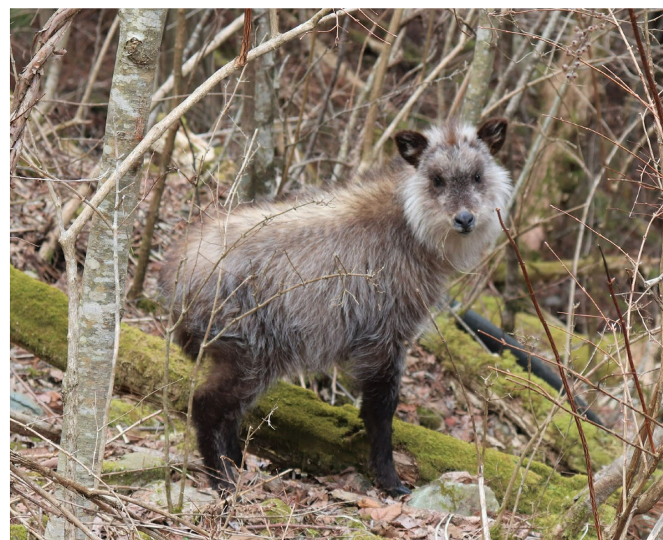
国指定剣山山系鳥獣保護区