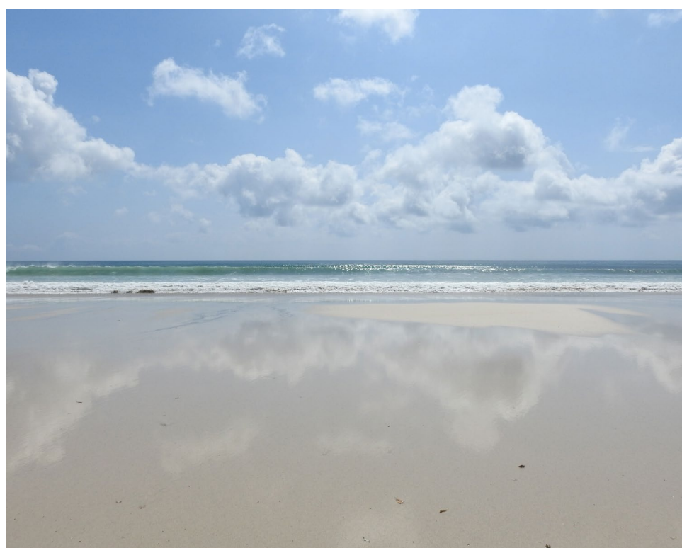
足摺宇和海国立公園