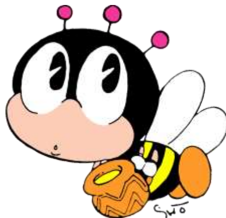
生涯学習のマスコット “マナビイ”