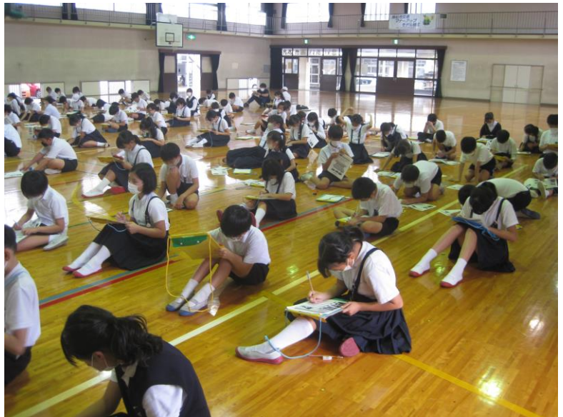
【クイズについて考えている様子】