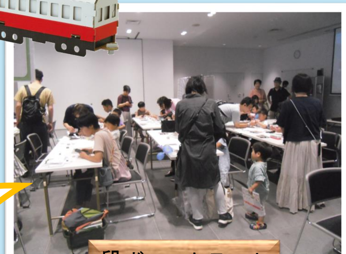
段ボールクラフト

場所：高松市こども未来館 多目的室 対象：中学生以下 (3年生以下は保護者同伴)