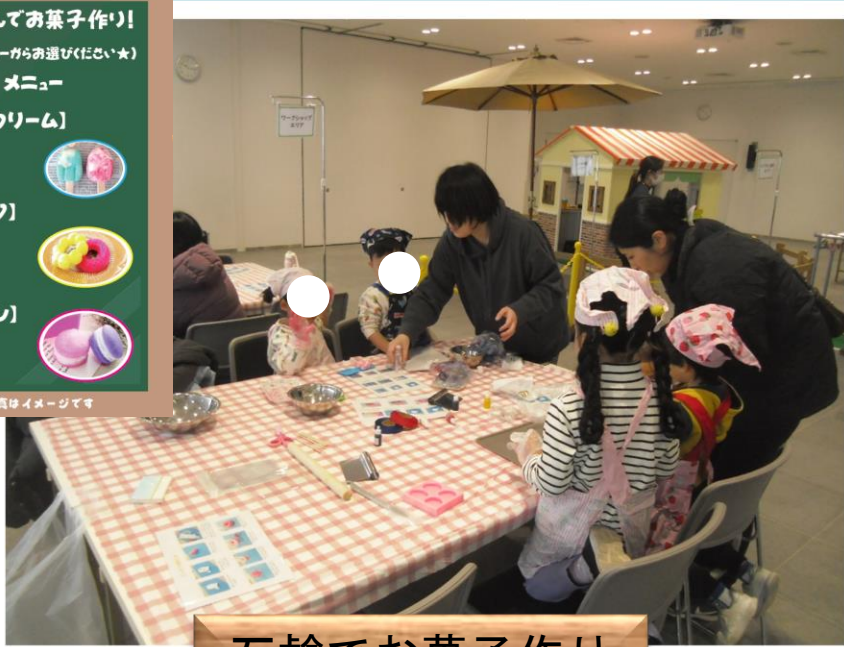
石鹸でお菓子作り