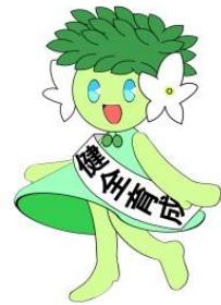
高松市青少年健全育成マスコットキャラクター 「育実ちゃん」

Tel: 087-839-2635 Fax: 087-839-2624 e-mail ikusei@city.takamatsu.lg.jp