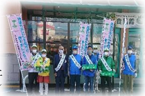
市中キャンペーン