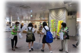
万引き防止「スマートメディア」キャンペーン

少年育成委員により組織され、委員相互の連携やより一層青少年の健全育成に寄与することを目的に、市内一斉補導や健全育成作品展の開催、各種健全育成に係る街頭キャンペーンなどに取り組んでいます。