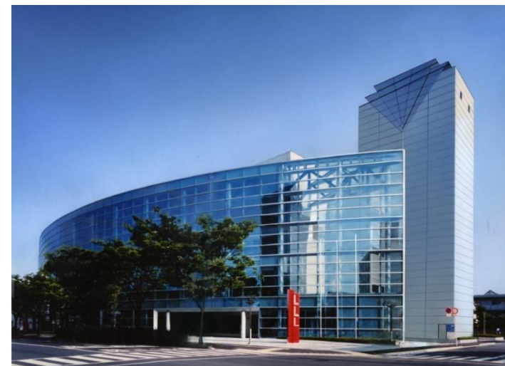
サンクリスタル高松外観