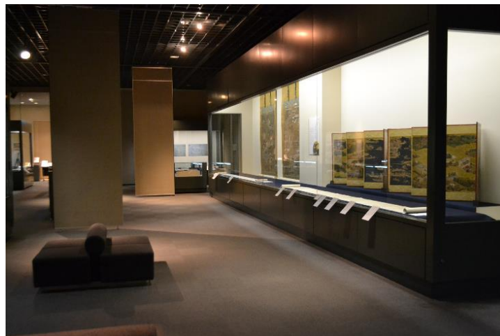
歴史資料館企画展示室