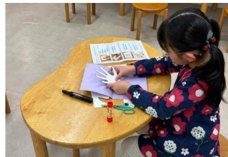
こどもアートスペース(こども+)