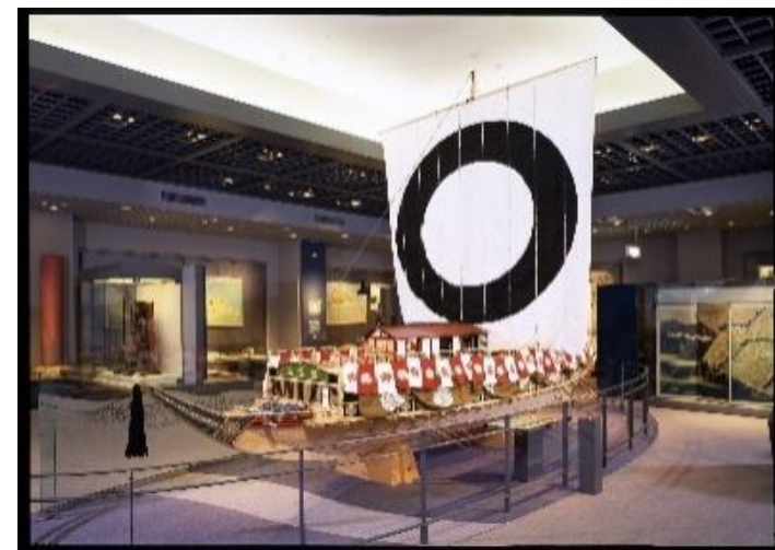
歴史資料館常設展示室