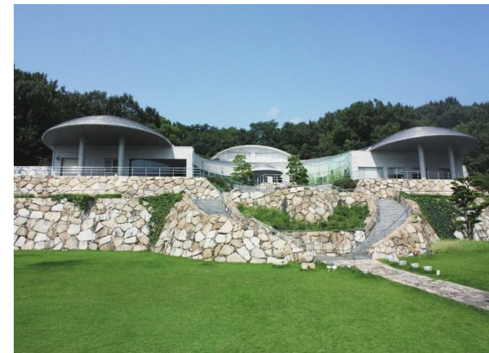
石の民俗資料館外観