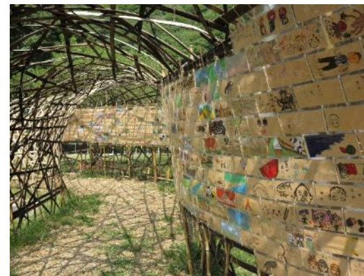
みんなでトンネルアート