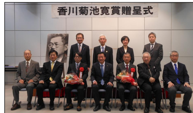
香川菊池寛賞贈呈式