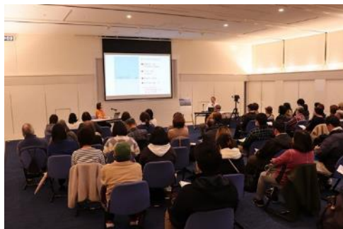
アートアドバイザー講座