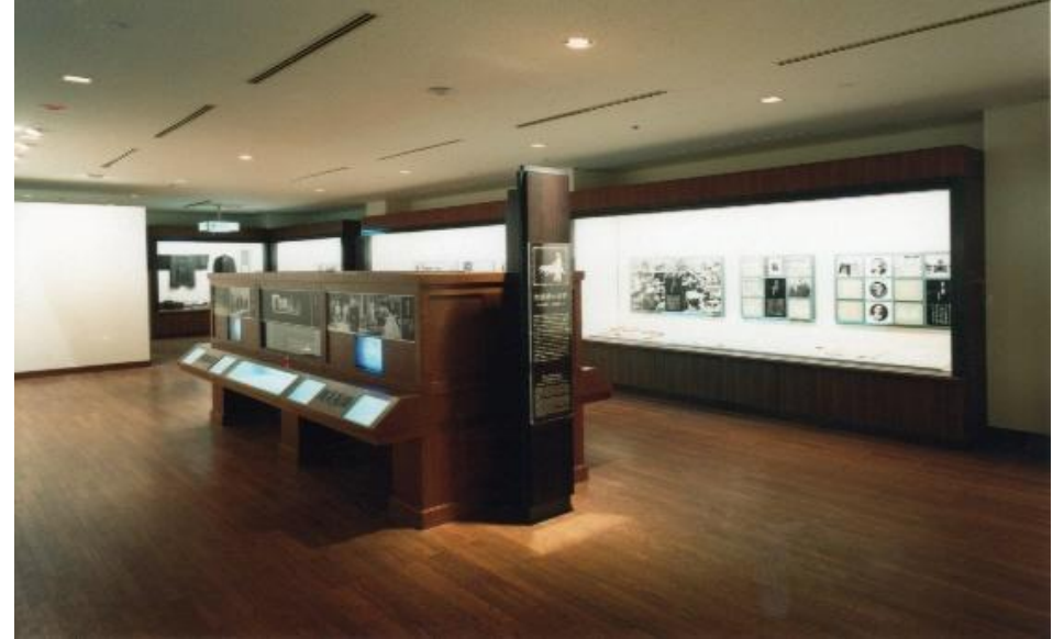
菊池寛記念館常設展示室