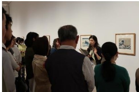
ギャラリートーク