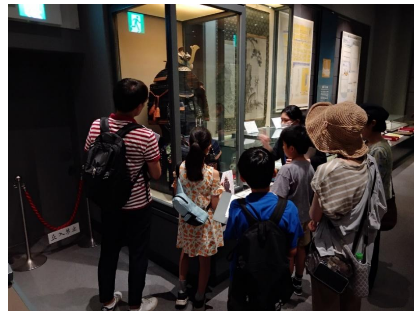
夏休みこども歴史講座