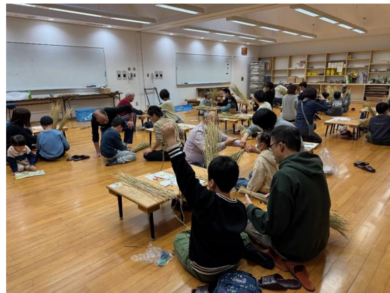
親子文化財教室（冬）