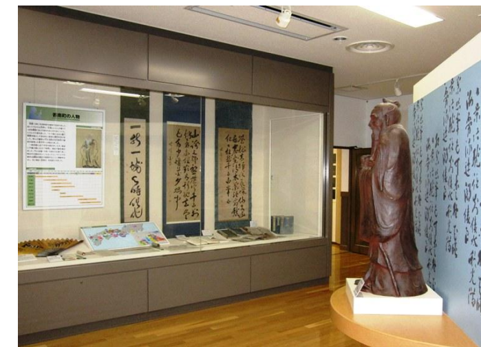
香南歴史民俗郷土館歴史展示室