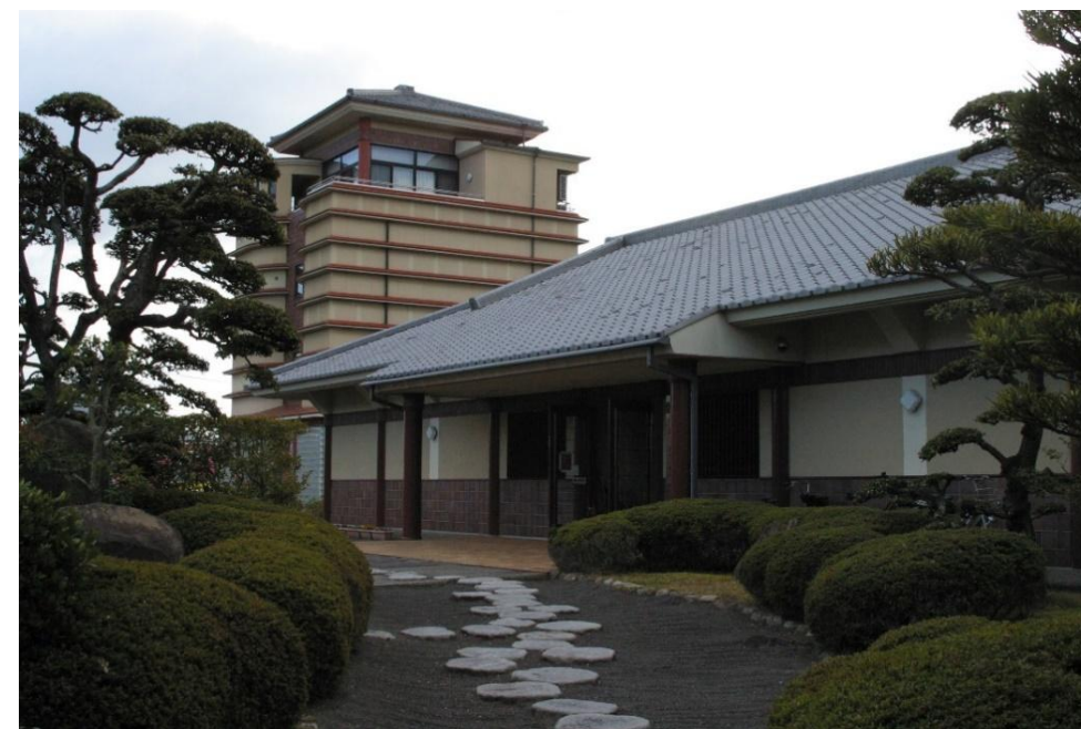
讃岐国分寺跡資料館外観