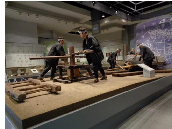
石の民俗資料館常設展示室