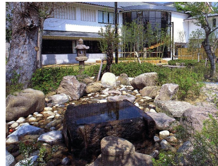
香南歴史民俗郷土館外観

【内訳】歴史資料4,257点、民俗資料414点、美術資料9点、考古資料120点、自然資料126点、その他365点