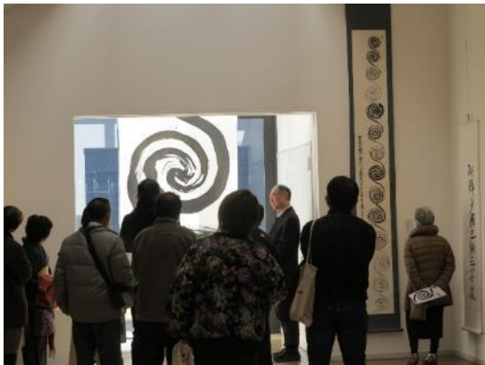
ギャラリートーク