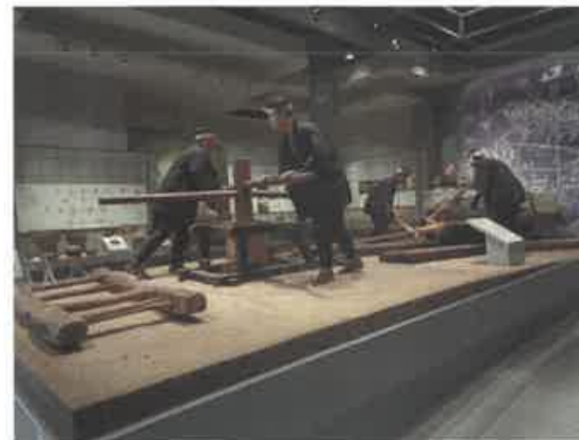
石の民俗資料館常設展示室