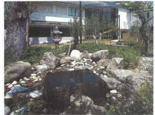
香南歴史民俗郷土館外観

【内訳】歴史資料4,254点、民俗資料411点、美術資料9点、考古資料120点、自然資料126点、その他365点