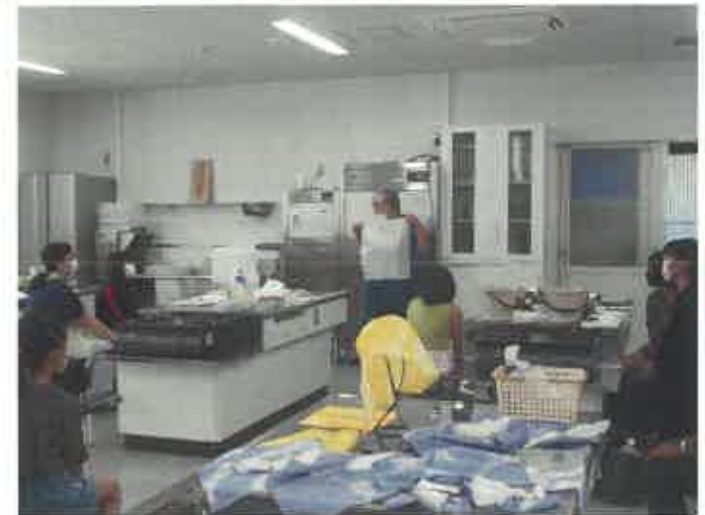
令和4年度親子文化財教室（夏）