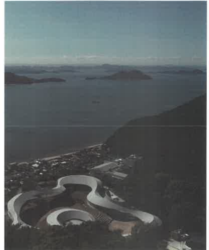
高松市屋島山上交流拠点施設「やしまーる」

※来場者数が前回の6割程度に留まった（海外からの来場者が激減（前回23.6%→今回1.3%）したことが要因の一つ）。