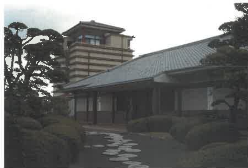
讃岐国分寺跡資料館外観