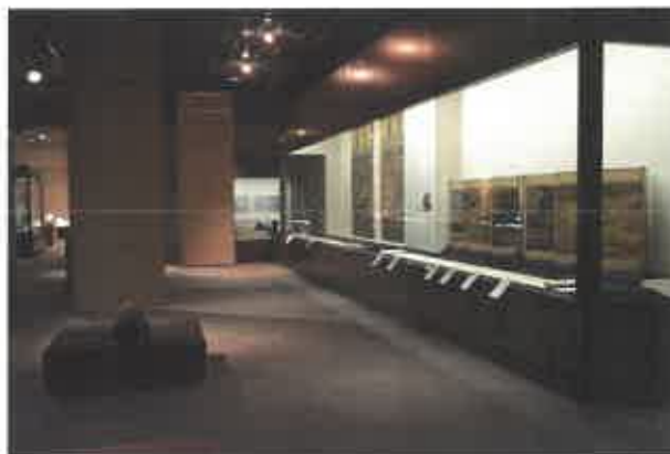
歴史資料館企画展示室