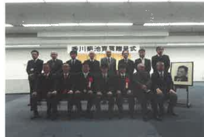
香川菊池寛賞贈呈式