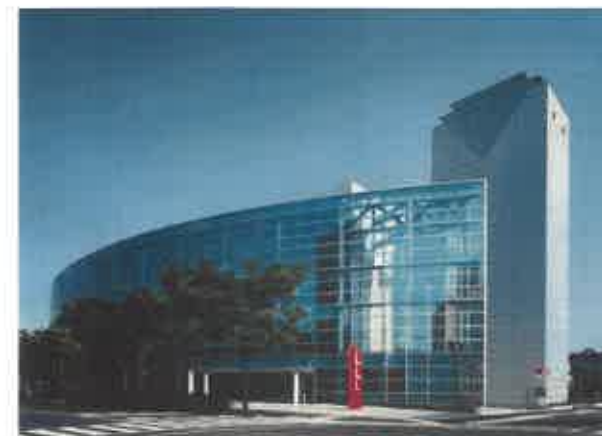
サンクリスタル高松外観