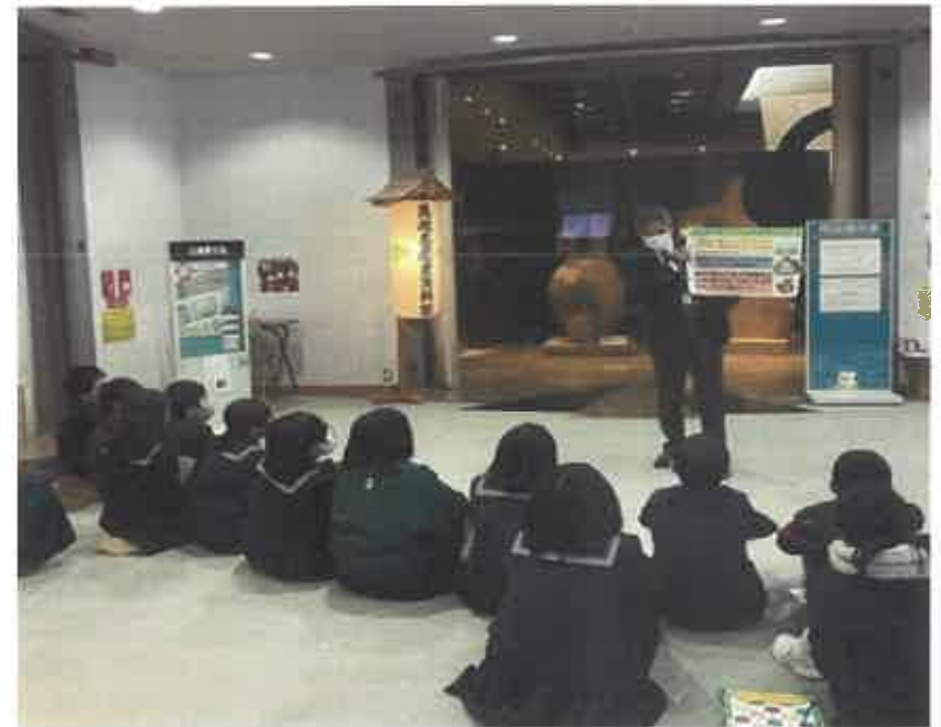
サンクリスタル学習