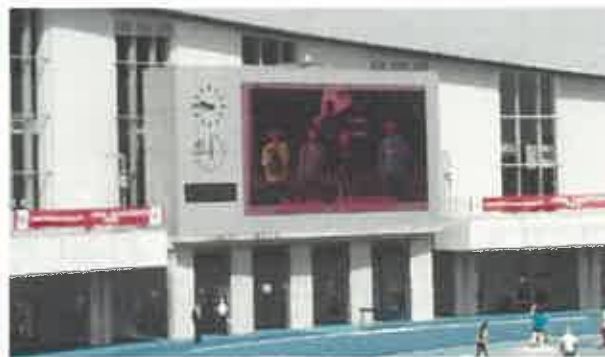
【2021ジャパンパラ陸上競技大会の様子】