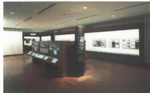
菊池寛記念館常設展示室