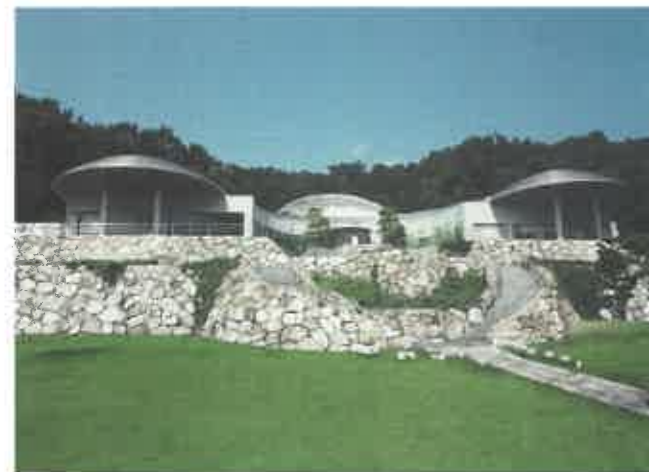
石の民俗資料館外観