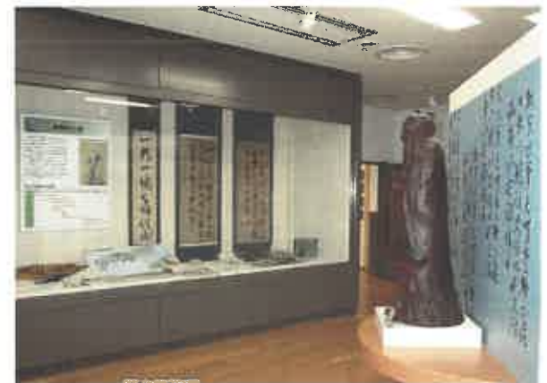
香南歴史民俗郷土館歴史展示室