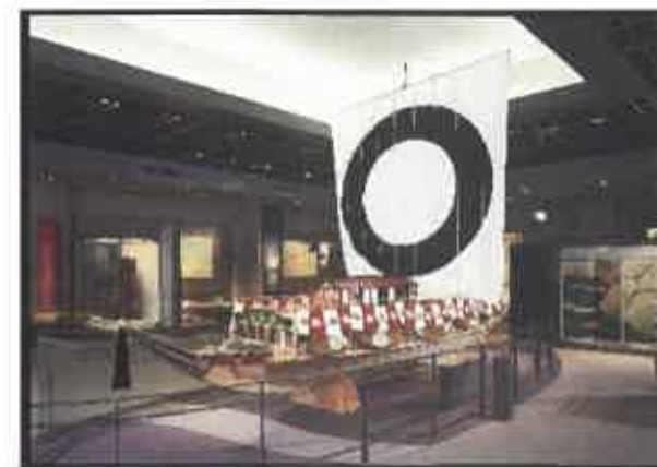
歴史資料館常設展示室