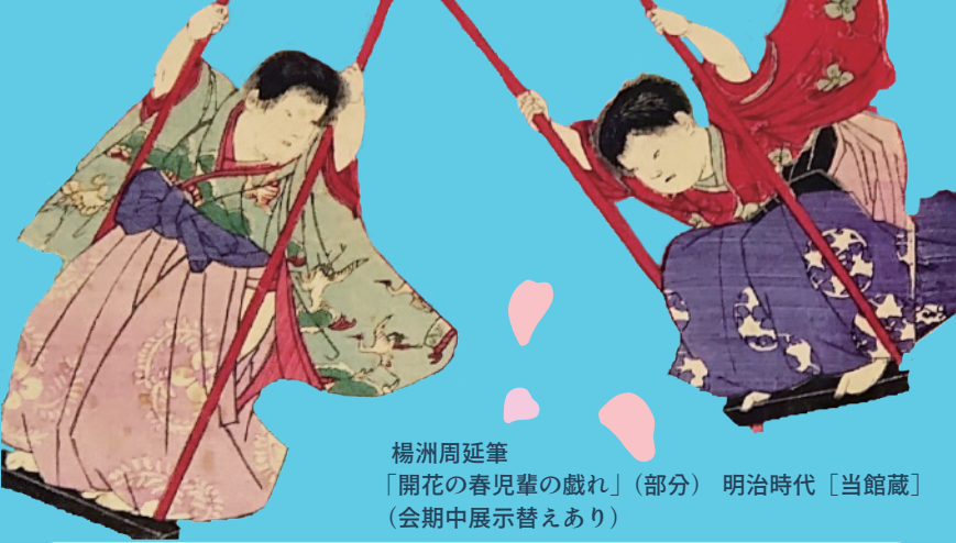
楊洲周延筆 「開花の春児輩の戯れ」(部分) 明治時代 [当館蔵] (会期中展示替えあり)

日々の生活から少し離れて、ささやかな非日常を味わう。それが「おでかけ」の楽しみです。