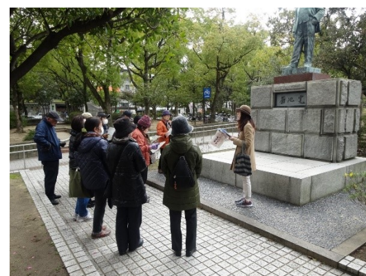
ブラリきくちかん

場所：高松市中央公園菊池寛像前集合 定員：先着20名（2/7より菊池寛記念館受付か電話にて申込）