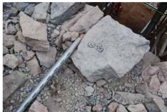
①排水補強パイプ施工状況（城壁側）