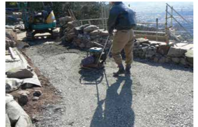
⑯吸出し防止層転圧状況