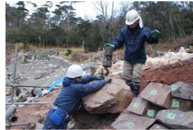
③石積みの解体状況