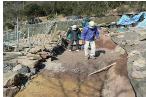
⑭背面列石施工状況