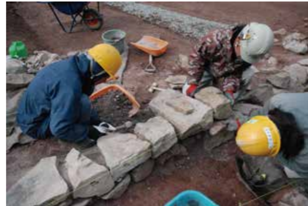
⑩築石背面盛土施工状況