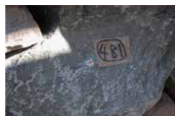
⑥計測鉤（新補石材用）