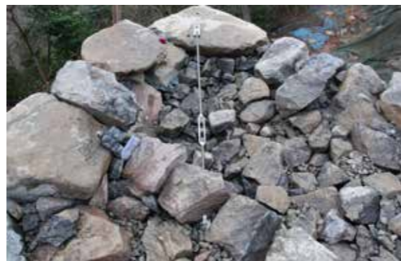
②角石（新補石材）引っ張り状況