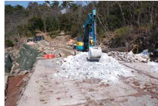
⑪旧盛土への酸化マグネシウムの添加