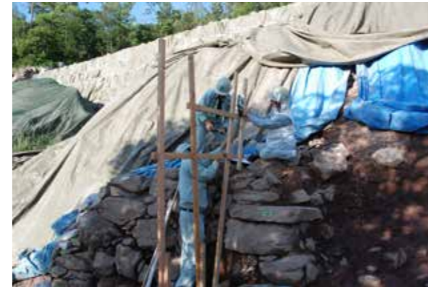
⑦丁張り（石積みの勾配）設置状況