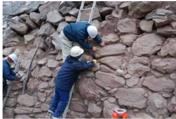
①石積みへの番付けと墨打ち状況

平成19年度から実施してきた屋嶋城跡城門遺構整備事業はあしかけ6年で城門南側の城壁の修復を終えました。工事が本格的化した20年度以降、転石の回収（平成20年）城壁の解体（平成21～22年）、城壁の試験的施工（平成22年）、城壁の積直し（平成23～24年）を経て、全長35m、高さ6mにおよぶ城壁が往時の姿を取り戻しました。