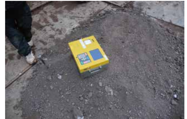
⑫土の含水比等の確認