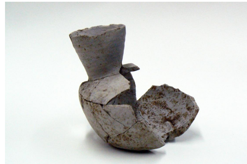
平成21年度発掘調査出土須恵器平瓶

【須恵器平瓶】須恵器は5世紀に朝鮮半島から伝わった轆轤(ろくろ)と窯を用いて製作する技術によって、平安時代まで生産された。青灰色を呈し硬い陶質の土器で、古墳副葬品などの祭祀供献用、宴席などの供膳用、日用品で用いられた。