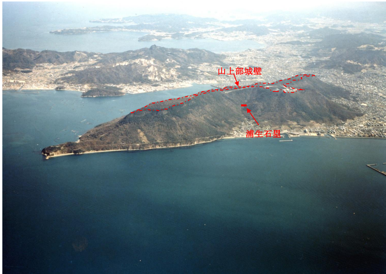
(空中写真一屋嶋山上の城壁と浦生石塁の位置一)