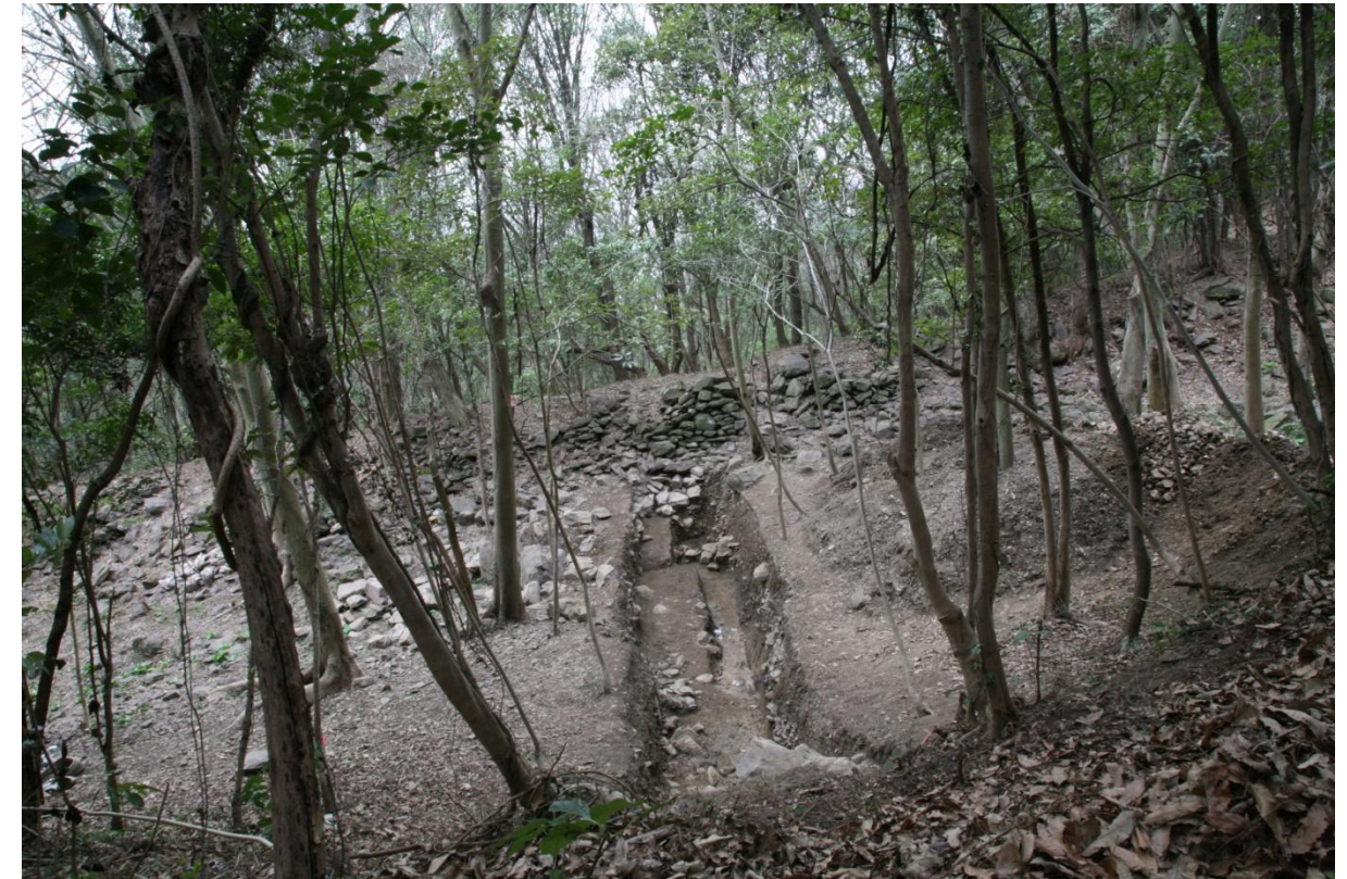
石塁遺構内側の状況（奥に見えるのが石塁、手前の調査範囲の底が造られた当時の地面）

今回の調査で須恵器が出土した深さから考えると、石塁が造られた当時の地面は今よりも低く、現在は埋まっている部分も多いことが分かってきました。今、地表に見える石塁から物見台・城壁、城門・水門の遺構が推定されていますが、さらに別の遺構や当時使われたものが埋まっている可能性があり、今年度以降も調査を継続して行う予定にしています。今後の調査により浦生の石塁が、古代の山城としてその内容が明らかとなれば、屋嶋城を山上の城壁遺構に加えて、山の中腹にも防御機能を備えた城として考えることができることになるでしょう。