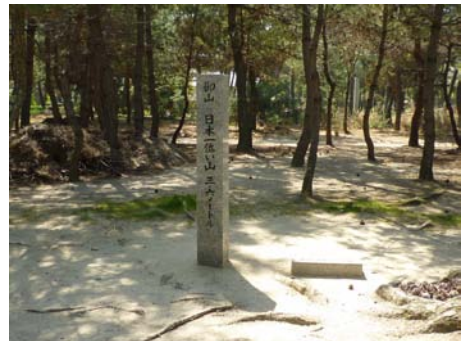
日本一低い山、御山