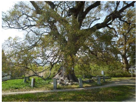
白鳥神社のクスノキ

かつて、白鳥の地に多く見られたクスノキは、現在では、切り倒されるなどして、往時より数が減っているようですが、白鳥神社周辺の住宅街を散策すると、ところどころに、その枝葉を茂らせている姿を目にすることができます。