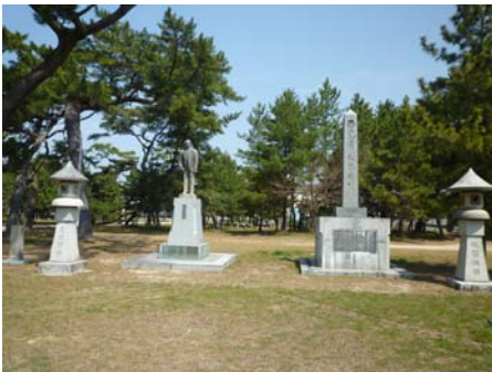
両児舜礼の碑(右)と棚次辰吉の銅像(左)