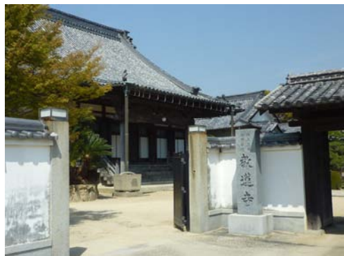
教 蓮 寺