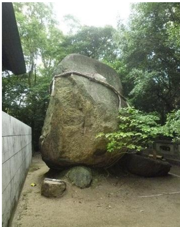
巨石磐境（いわさか）