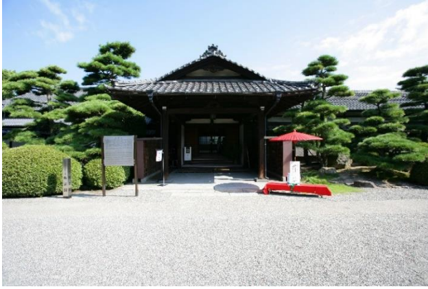
玉藻公園(史跡高松城跡)披雲閣