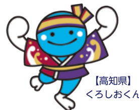
【高知県】 くろしおくん