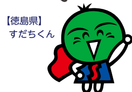
【徳島県】 すだちくん