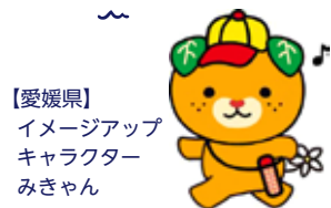
【愛媛県】 イメージアップ キャラクター みきちゃん