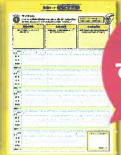
記録シート版 (WEBサイトからダウンロードできます)