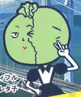
ビューティフル レタ子