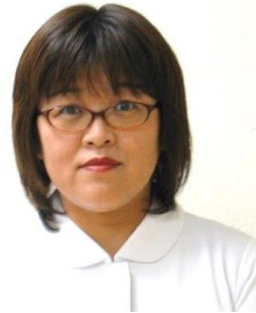
市民病院 看護主任