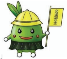
高松市交通安全シンボルキャラクター「まもりーぶちゃん」

高松市中心部には、自転車、歩行者、自動車が、それぞれ安全・快適に通行できるよう、自転車道などの自転車通行空間が整備されています。