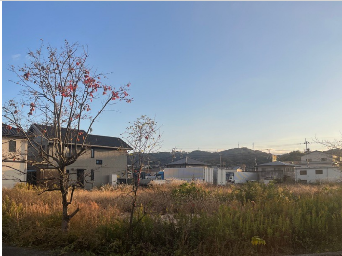
現況写真（北西から撮影）