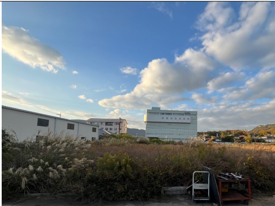
現況写真（西方から撮影）