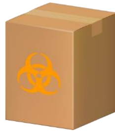
段ボール容器 (内袋使用)