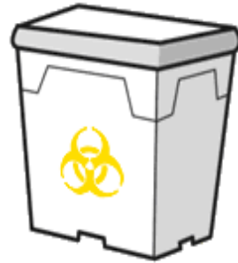
プラスチック製容器