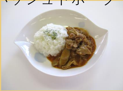
高松市食生活改善推進協議会