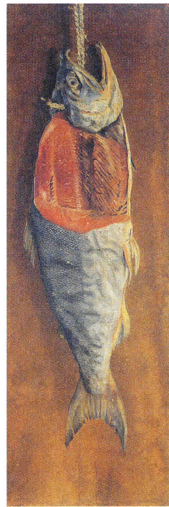
高橋由一《鮭》 1877(明治10)年頃 油彩・紙 東京藝術大学所蔵

美味しそうな(?)美術作品を捜し出し、勝手に味見したり感想を述べる「突撃アートの晩ごはん」。 2回目のメニューは、高橋由一(1828~94)の《鮭》を取り上げました。