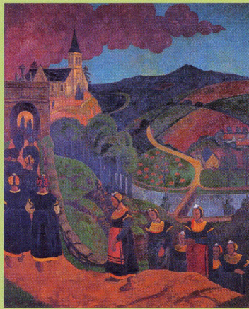
ポール・セリュジエ《ノートル＝ダム＝デ＝ポルトのバルドン祭》1894年頃