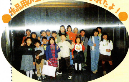
作品用のエレベーターにものれたよ!