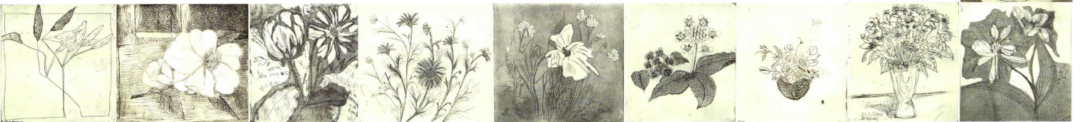
版画ワークショップ参加者による作品。

面持ちでした。今回のワークショップを通し、版画の技法に関する理解は以前に比べるかに深まりましたし、また版画作家にとって、優秀なプリンターとの出会いがいかに大切であるかという新たな発見もありました。今後のギャラリートークに生かしていきたいと思ひます。 [石原ミエ子]