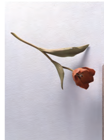
須田悦弘《チューリップ》2002年 高松市美術館蔵 ©Yoshihiro Suda / Courtesy of Gallery Koyanagi

高松市美術館では既に何度も、意外な場所に登場して人々を驚かしてきたチューリップ。 作者の須田は他に雑草の作品も手がけていますが、直島の美術館などで「えっ！？…なんで こんなところに雑草が…」とびっくりした方も多はず。