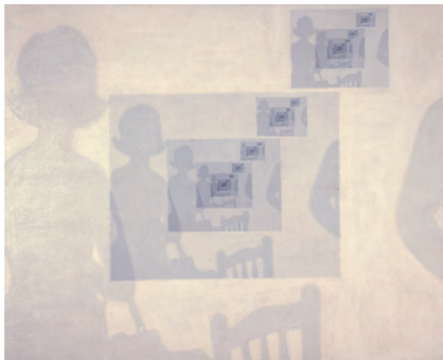
高松次郎《影の圧搾》1965年 高松市美術館蔵 ©The Estate of Jiro Takamatsu, Courtesy of Yumiko Chiba Associates