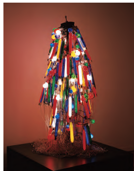
田中敦子《電気服》1956年(1986年再制作) 高松市美術館蔵

高松市美術館は1年余りの改修工事を終え、2016年3月26日にリニューアルオープンとなりました。それを記念し、3月26日～4月17日、「高松市美術館コレクション展—今知りたい、私たちの『現代アート』」を開催し、国内外から高い評価をいただいている日本の現代アートコレクションから、選りすぐりの名作約110点を紹介。ここではその中から、特におススメの4作品をご紹介します。