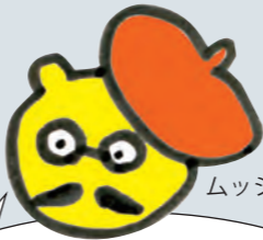
ムッシュ・ハカセ

まずは歴史のおさらいじゃ。 高松市美術館は 1949年 、 高松市 の 名勝・栗林公園 の中に 戦後初の公立美術館 として オープン し、 その後 1988年 、ちょうど瀬戸大橋が開通した年に、 市街中心部の今の場所に移り、 新築オープン したのじゃ。