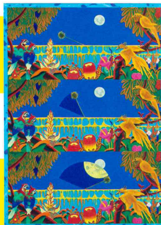
《Wiper in Jungle》 1975年