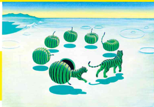
『とらのゆめ』原画 1984年 個人蔵