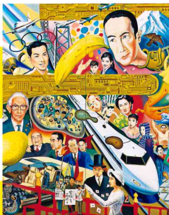
《昭和素敵大敵》(部分) 1990年 田川市美術館蔵