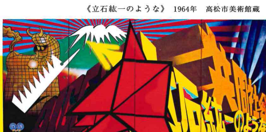
《立石紘一のような》1964年 高松市美術館蔵

立石は1998年4月に56歳という若さでこの世を去りましたが、生誕80年をむかえる今年、約200点の作品・資料によってその多彩な活動をふり返ります。