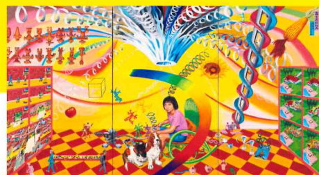
《富士のDNA》1992年