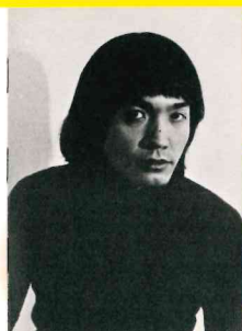
アレクサンドル・イオラス画廊「TIGER TATEISHI」カタログより 1972年 埼玉県立近代美術館資料閲覧室蔵

Biography: Tiger Tateishi was born in Japan, in December 1941. He came from Tokyo to Italy in March 1969, and since then he has been in Milan. The paintings in this book were produced between 1969 and 1972. He had an exhibition at Gallery Iolas-Geneve in October 1972.