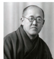
大田区立郷土博物館蔵