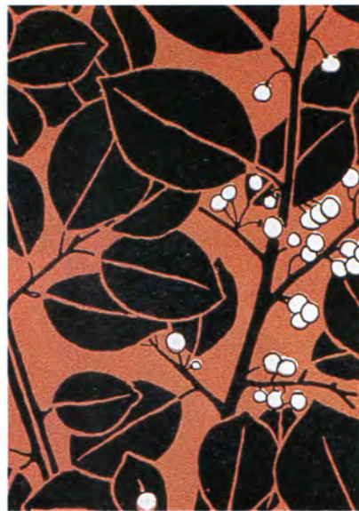
コロマン・モーザー《夕べの静けさ》オーストリア国立工芸美術館所蔵

19世紀後半に盛んに開催された万国博覧会を一つの契機に、ヨーロッパで日本の版画や工芸品が流行しました。このジャポニスムと呼ばれる現象は19世紀末のウィーンにもあらわれ、伝統的な歴史主義から抜け出そうとしていた若い芸術家たちを触発しました。彼らは日本美術のモチーフや構図を自分の作品に取り入れ、新しい傾向を展開していったのです。今回の展覧会では、繊細な装飾性を持つグスタフ・クリムトやエゴン・シーレの絵画、工芸デザイナーのコロマン・モーザー、建築家のヨーゼフ・ホフマンらの約250点の作品により、彼らがジャポニスムに刺激されるようになった背景、そしてその中で日本の美術から何を受容したのかをたどります。