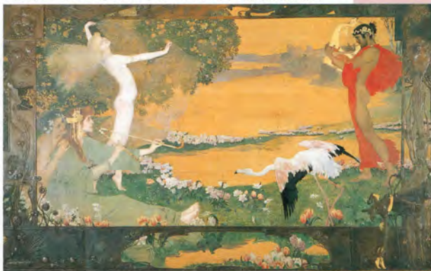
エルヴィン・プッヒンガー《音楽室のためのパベル・神話の場面》オーストリア国立工芸美術館所蔵