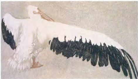
ヴァルター・クレム《ペリカン》オーストリア国立工芸美術館所蔵