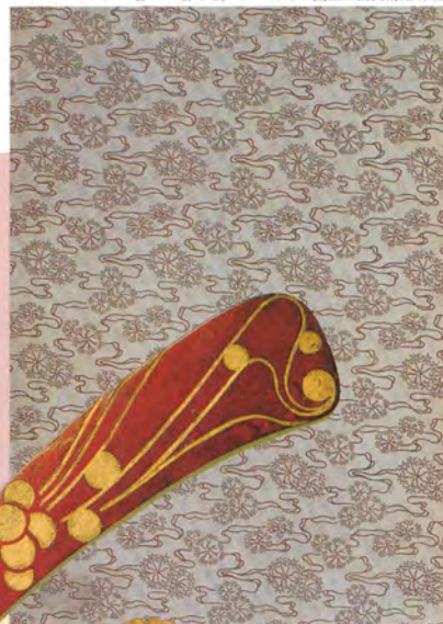
コロマン・モーザー《花の文様のついた見返し》オーストリア国立工芸美術館所蔵