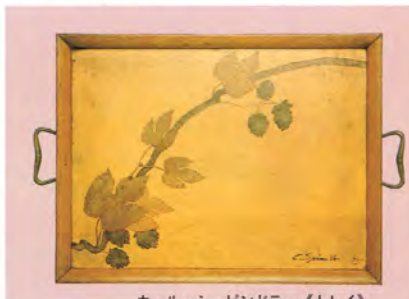
カール・シュビンドラー《トレイ》オーストリア国立工芸美術館所蔵