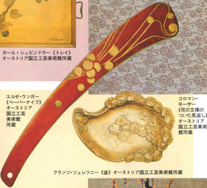
フランツ・ツェレツニー《盆》オーストリア国立工芸美術館所蔵