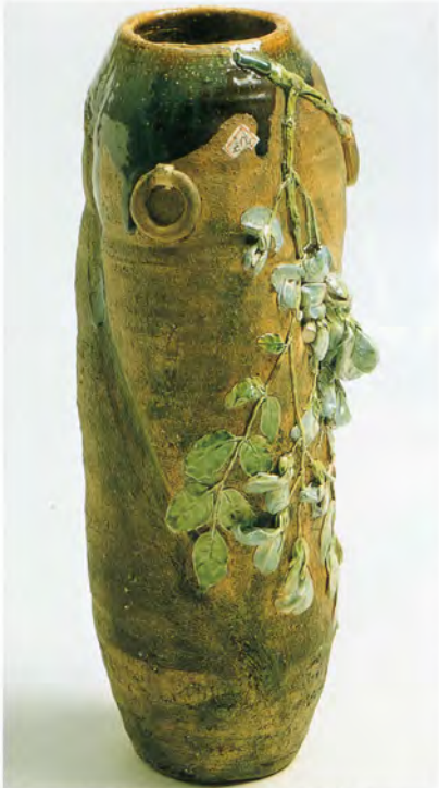
マイアー《花瓶》オーストリア国立工芸美術館所蔵