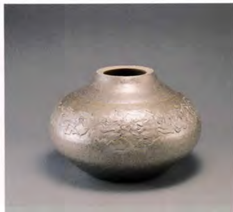
工芸美術「白陽 連ナル華 飾壺」浅蔵 五十吉