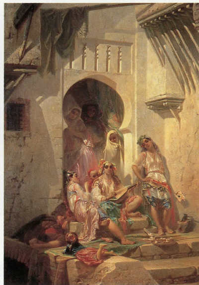
ジロー「アルジェの女たち」1859