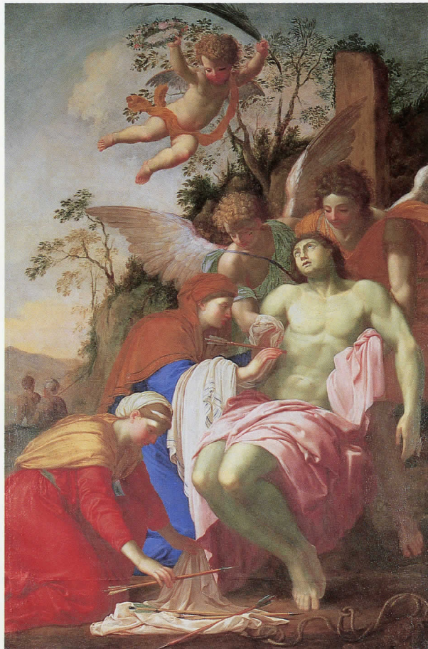
ル・シュール「聖女たちに介抱される聖セバスティアヌス」