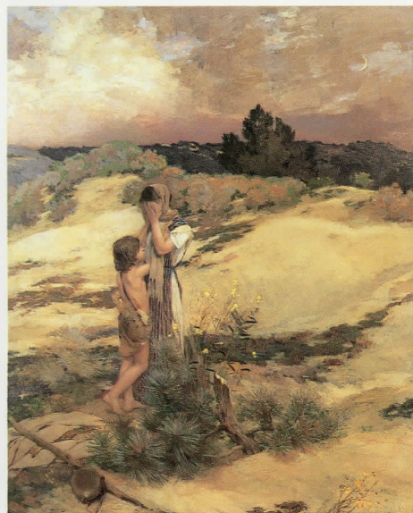
カザン「アガルとイシマエル」1880