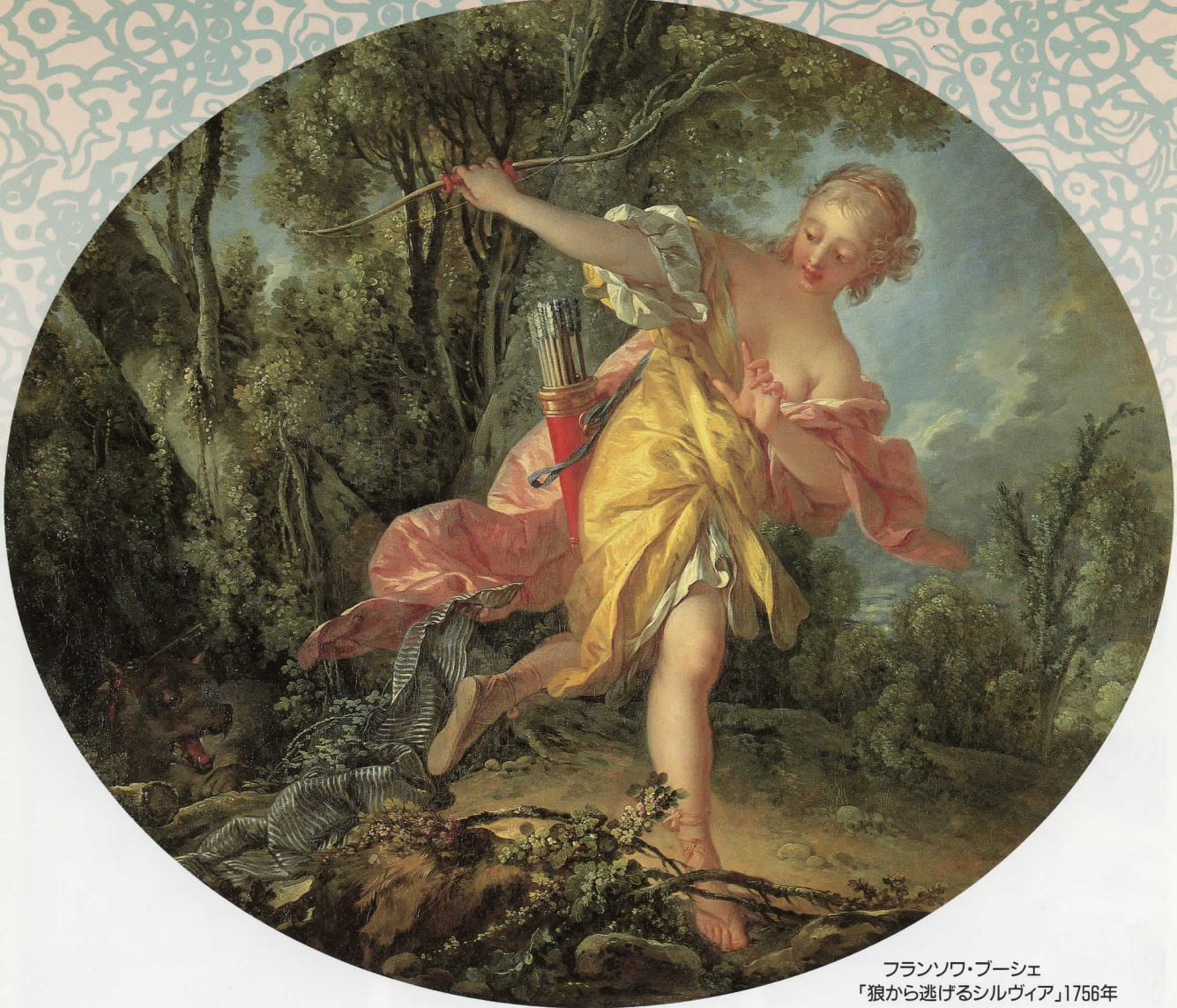
フランソワ・ブーシェ 「狼から逃げるシルヴィア」1756年