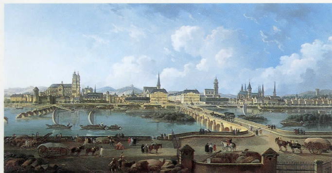
ドゥマヌー「トゥール景観図」1787

日本で初めて開催される本展は、この豪華なコレクションの中から、17世紀から19世紀までのヨーロッパ美術の流れを主にフランス絵画を中心に紹介していきます。荘厳華麗なバロック様式から静謐で厳格な古典主義様式、ロココ時代の優美繊細な宮廷美術、19世紀のオリエンタリズムやサロン画家たち、そして印象派まで、選りすぐった80作品を展覧します。ロワール河からの秋風を本展にのせてお届けします。