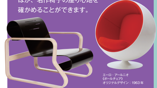
アルヴァ・アアルト《41 アームチェア ハイミオ》 オリジナルデザイン 1932年、アルテック © Artek

アルヴァ・アアルト《41 アームチェア ハイミオ》、エーロ・アールネオ《ボールチェア》ほか、名作椅子の座り心地を確かめることができます。