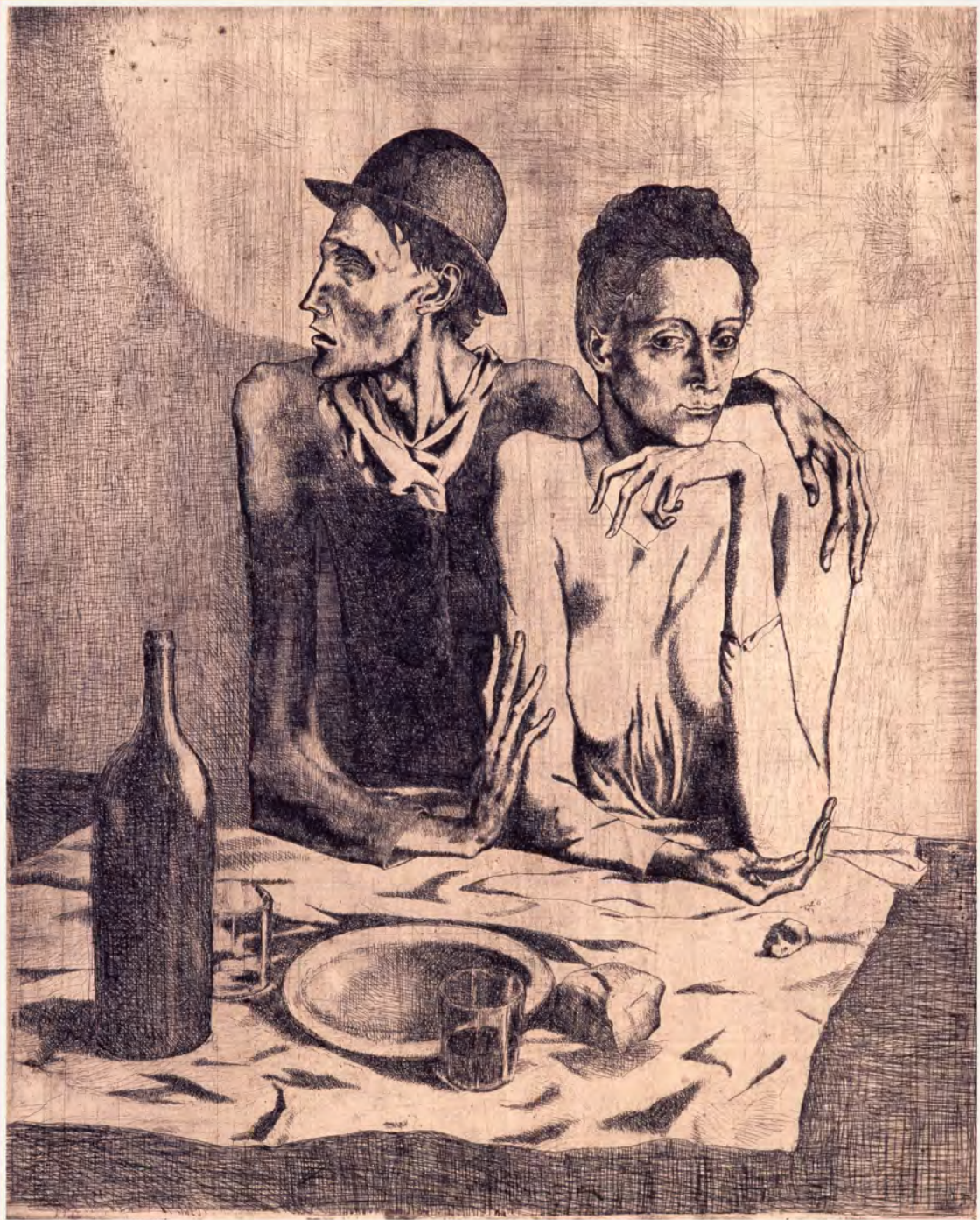
『喰い』(1904年) ピカソ、ロレンス